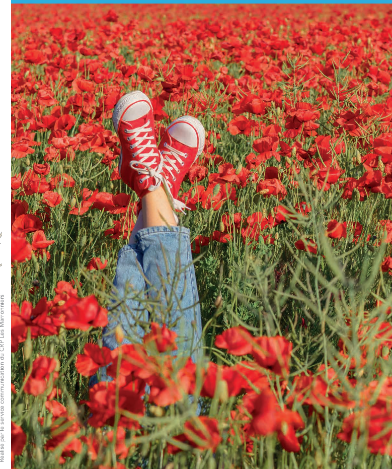
Réalisé par le service communication du CRP Les Marronniers

RUE DESPARS 94 7500 TOURNAI TÉL : +32 (0)69 880 211 www.marronniers.be